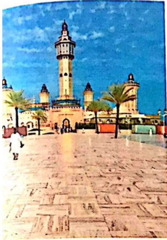
جامع طوبى المحروسة

تواريخ ومعلومات مهمة عن الجامع (1963-1925)